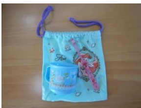
コップ・ハブラシ用巾着袋